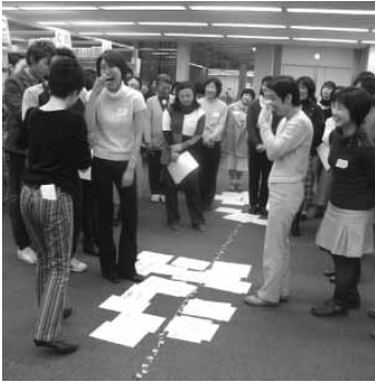
参加者が書いた行為の感染の可能性を話し合う。これってどういう意味だろう？

てきて、「過激すぎる」とクレームを付ける。自らは何の努力もしないで、騒ぎ立てるだけ。それに一部の新聞や雑誌が悪のりする。それが、「性教育」だ。