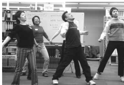
できる範囲でセクシーポーズ! みんなでやれば恥ずかしくない!!

後半では、リスクアセスメント、体操(ラジオ体操の音楽に合わせて激しくセクシー?に踊る)、コンドーム風船バレーボール(ボールに触る時にテーマの言葉を言う。例:セックスをしてみたい場所)などの参加型プログラムを実施しました。皆さんとても乗り気。さすが玄人です。バレーボールでは、参加者チームとぶ PEPチームで対決し、これまた熱い闘いが繰り広げられました。恥ずかしがる暇もなく楽しい雰囲気の中で性に関する言葉が飛び交うバレーボールは、なかなか好評だったようです。全体的にもプログラムに共感して下さる意見が多く、中には「いま日本でこれ以上のものを探すのは難しいくらいレベルが高い」とまで言ってくれた方もいます(言い過ぎ?でも超感激しました)。今回のようなプログラムを通して、一人でも多くの人にぶ PEPのコンセプトが広まっていけば良いと思います。(キャミー)