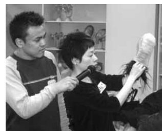
おなじみ100円ソックスを利用したゴムつけパフォーマンス。代々女性に伝承されていくとか。