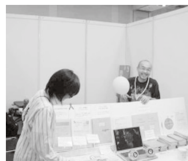
ぶれいす東京のブースにて