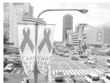
三宮駅にもレッドリボン

そもそも、「ユース」「若者」というざっくりとしたくりには少し抵抗を感じたけれど、同年代で色々な取り組みをしているひとたちと一緒にフォーラムを作ったことがとてもよい経験になった。フォーラム全体の結論は、一言に「若者」といっても、立場も活動もさまざままだということ。そんな多様な主体がフォーラムを完成させる中でつながることができたこと自体が意味のあることではないだろうか。青臭くつまらない結論ではあるけれど、そのことを実感できたことは少なくとも自分には非常に意味があった。スピーカーの中には知っている人なのに少し立場として距離感を感じていた人もいたのだが、フォーラムについての話し合いをする中で、忌憚なく意見をぶつけあうことができた。顔見知りといった程度の関係ではなく、お互いの活動の原動力や深いところの気持ちを交換することができる関係を築くことができたように感じ、このことが今回のICAAP全体を通して、自分にとって一番意義のあったことだと思う。