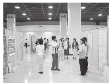
ポスター展示会場

実際の展示期間は7月2日から4日まででしたが、3メートル四方の空間に国境を越えた親善と交流の花が咲いた3日間となりました。