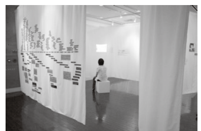
Simple Days—さまざまな想いが伝わっていく

7th ICAAPに先駆けて6月30日から4日間、神戸アートビレッジセンターでkavcaap2005が開催された。アート(表現)を通じてエイズについての必要な情報