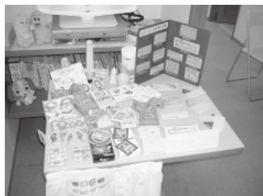
コンドーム・ピルの展示コーナー「手にとってみて！」

もうひとつは、「お医者さん」に私が圧倒されてしまうこと。インテリアとか雰囲気は私にとっては上品に感じられるからか、