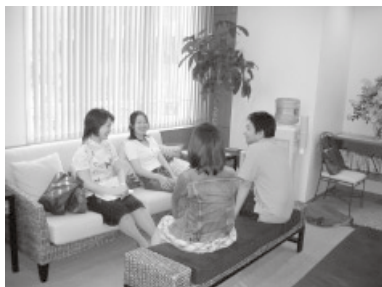
バリ島の雰囲気? 待合室です

最近では性教育バッシングの影響で学校や保健所からのプログラム依頼も減っているの、現場で若者と直接触れ合う機会が少ない。こんな御時世にどうやってHIV啓発をしていけばい