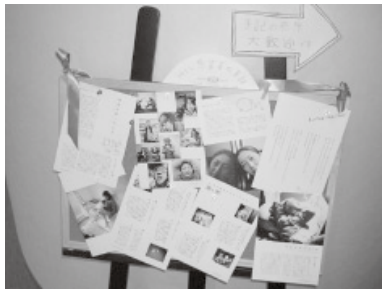
HIV 陽性者の手記のコーナーもあります

置されたコンドーム・ピルの展示コーナーでは実際にいろんな種類のコンドームに触れて自分に合ったものを見つけることができるし、ぴあスタッフから正しい装着方法を楽し