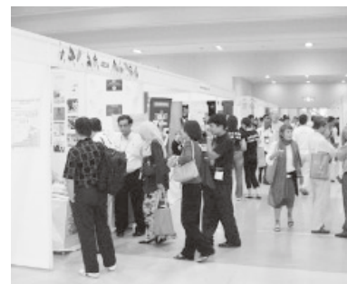
市民開放 DAY に賑わうブース会場