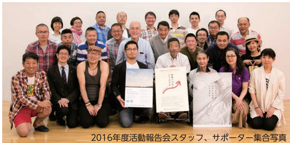
2016年度活動報告会スタッフ、サポーター集合写真

性別、年齢、セクシュアリティ、HIV/エイズの知識や活動参加の経験の有無などは問いません。関心のある方はオリエンテーションにご参加ください。活動に参加する/しないは、オリエンテーション終了後に決められます。研修参加の条件は、3日間の基礎研修を受講し、修了後必ず1年以上活動できることです。研修では、多彩な講師陣