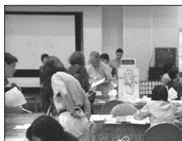
いろいろなNGOがエクスチェンジ中!

の参加がありました。こうした、コミュニティでの横のつながりも必要なんだということも実感。それゆえに人見知りな私もできるだけいろいろな方と積極的にお話しなければと、その後に行われた交流会にも参加して参りました(ほんま疲れた...)。肝心のリクルートですが、参加者が少なく思うようにいきませんでした。コミュニティのつながりという点から有意義な時間が過ごせたのではないかと一人思った次第でございます。これが少しでも今後につながると思います。