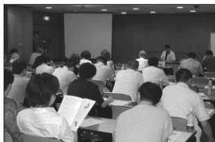
50名以上の参加者でほぼ満席

最後になりましたが、参加いただいた皆様ありがとうございました。(来年はもっと仕切れるようにこれからトレーニングに励みます。)