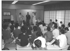
たたみに座布団、和会議室ならではの様子

といった、ゲイ歴10数年経ってしまった僕にとっても役立つ情報がたくさんで初心者の方はもちろんの事、上級者?の方にも役立つのではないかと思います。