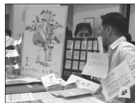
ぶれいすスタッフ同士もエクスチェンジ中.....?