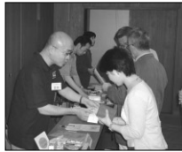
活動報告会の受付にて「懇親会もどきぞ」

今年では会場の都合で18時開始予定でしたが、開催側の不手際で開始時間がずれ込み、予定が押せ押せになってしまいました。特に総会では、出席された会員の方々の意見を十分に反映できるような、余裕を持った進行為反省点のひとつとなりました。(そうですね...反省...)