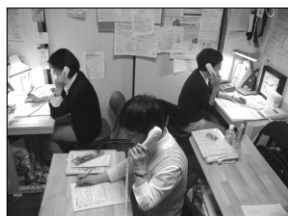
相談に熱中し、電源コードを足で誤って引き抜くこともあるとか？

ドラマの再放送や新聞報道等の影響でしょうか。こここのところ、予想を上回るペースで相談が多くなっています。今年も夏休み過ぎにはさらに増えるのでしょうか。息のぬけない状況を横目に、暑く長い新人研修を迎える季節となりました。（報告：沢井）