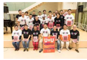
TOKYO AIDS WEEKS 2018終演後の1枚