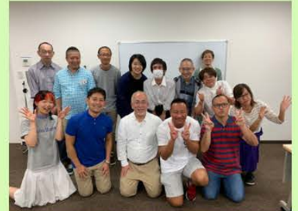
2019年の研修参加者(撮影可)とスタッフ

「自分らしく生きることを応援します」をモットーに、HIV/エイズや性感染症、セクシュアルヘルスをテーマとして、市民一人一人が自分らしく生きられるような地域の環境づくりに取り組んでいます。