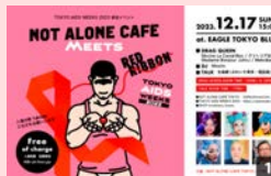
NOT ALONE CAFE MEETS RED RIBBON