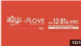
露出狂ナイト all LOVE