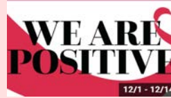
展示『WE ARE POSITIVE - UPDATE HIV!』