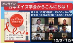
日本エイズ学会からこんにちは!