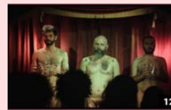
映画『神はエイズ』日本初上映!! + トーク