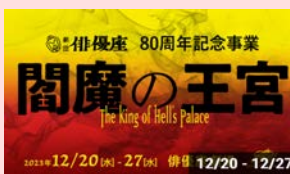
劇団俳優座『閻魔の王宮』

申し込み・問合せ先などの詳しい情報は、「TOKYO AIDS WEEKS」のサイトをご確認ください。