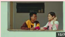
映画『虎の子三頭 たそがれない』東京初上映 + トーク