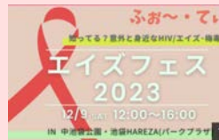
HIV・エイズ予防啓発フェス2023「知ってる? 意外と身近なHIV/エイズ」