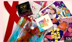
コンビネーションプリベンションツールの配布