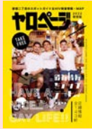
ヤローページ 2024 上野・浅草版発行