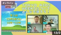
TOKYO AIDS WEEKSについてみんなで語ろう! 第2夜