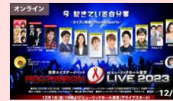
RED RIBBON LIVE 2023 (厚生労働省主催イベント)