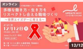
多様な働き方・生き方をリスペクトし合える職場づくり ~ 世界エイズデーに考える ~ (東京都オンライン講演会)