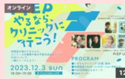
トークイベント「PrEPやるなら、クリニックに行こう!」