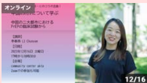
中国のHIVについて学ぶ 中国の二大都市におけるPrEPの臨床試験から