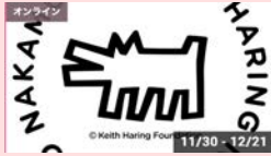
中村キース・ヘリング美術館 世界エイズデー2023