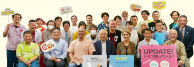
写真: 活動報告会(2024.5.25) スタッフ、ボランティア、ゲスト、寄付者、来場者の 同意を得た方々で撮影

活動に参加できるボランティアを募集します! 国籍、性別、年齢、セクシュアリティ、HIVの感染の有無は問いません。